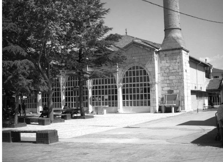
Namik Şenel'in imamlık yaptığı ve arkasında Bediüzzaman Hazretleri'nin namaz kıldığı Emirdağ Çarşıci Camii