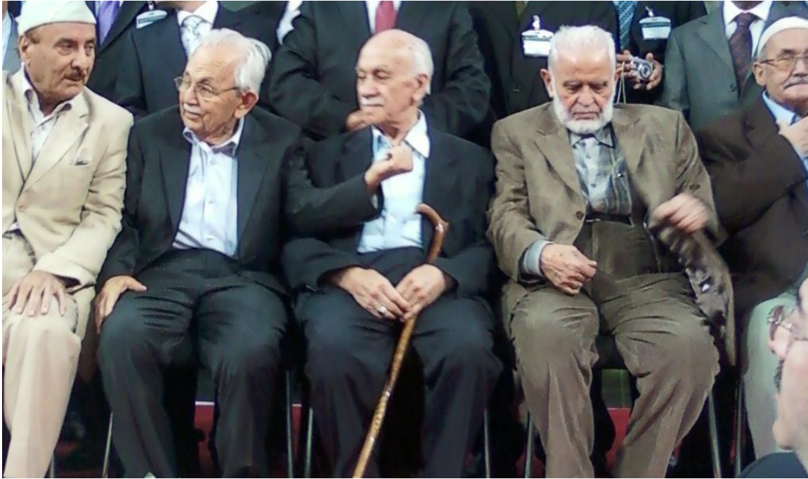
Nur hizmet kervanının çilekeş hadimlerinden

Sene 1958. Tanıştığımız arkadaşlardan birisi beni ısrarla tarikatına almaya çalışıyordu. Ben ne kadar izah etsem de olmadı. Malum Üstad Hazretleri "Mürşide karşı ifrat muhabbet caizdir" diyor. O kardeşimiz bana "Sen istihareye yat" dedi. Ben istihareye yatınca mürşidi beni çekecek yani, böyle inanıyor. "Mürşidimiz Kur'an'dır" desem de onun hatırını kırmamak için istihareye yattım. Kur'anı Kerim açıldı. Şahıs görmüyorum. Bana sure-i Mümin'den bir ayet gösterildi. Oku burayı denildi. Okudum: "Artık benim size ne dediğimi yakında anlayacaksınız ve ben işimi Allah'a ismarlıyorum. Şüphe yok ki O, kullarını görücüdür. Mümin 44", meali böyle. Birden uyandım. Heyecanla geldim arkadaşşa. Böyle böyle diye anlattım. "Ben rüyayı tabir edemem efendi hazretlerine götüreyim" dedi. İstanbul'a gidip soracak. Bir gün sonraki gecede yine bir rüya gördüm. Sure-i Bakara'dan bir ayet: "Artık her kim bunu işitip bildikten sonra tebdil ederse şüphe yok ki bunun günahı o tebdil edenlerin üzerinedir. Bakara181" mealinde. Artık tabire filan lüzum kalmamıştı.