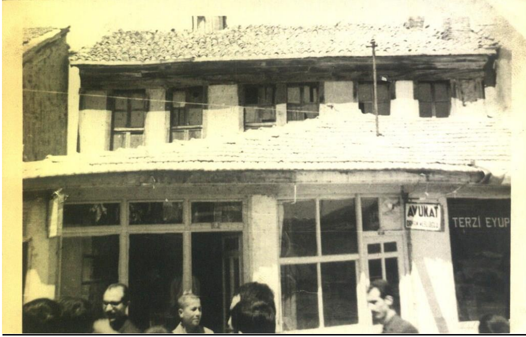
Bediüzzaman hazretlerinin Emirdağ'da kaldığı evin Uzunçarşı tarafından görünüşü.