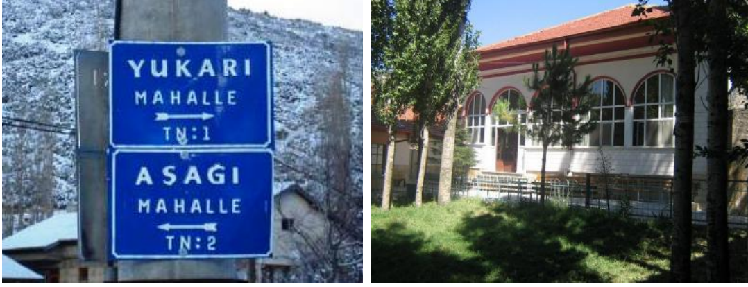
Sav kasabasında Yukarı ve aşağı Mahalle levhası ve Aşağı Mahallede Merkez/Dalboyunoğlu Camii